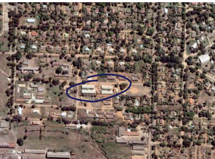
Die BOCCS-Schule im Zentrum der Stadt Kabwe

Wäre es nicht sinnvoller und notwendiger, wenn wir uns den Ländern, die noch kaum vom Evangelium erreicht worden sind, zuwenden würden? Ich möchte folgend aufzeigen, warum wir nicht „entweder oder“, sondern „sowohl als auch“ denken und handeln müssen. Unsere missionarische Hilfe in Sambia ist gefragt, so dringend wie eh und je. Mit anderen Schwerpunkten zwar, aber unerlässlich. So wie in anderen Ländern auch.